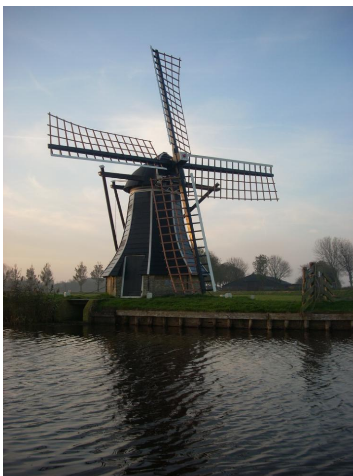
Ybema s Mole te Workum

Molentichting Nijefurd P/a Blauhûsterleane 2 8658 LJ GREONTERP IBAN NL54 FRBK 0914 0017 01