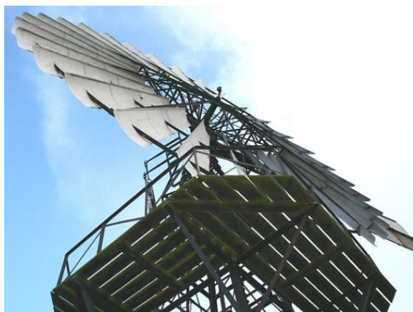
Windmotor it Skar

De windmotor van It Skar maalt regelmatig. Hier geldt net als voor de andere molens van de stichting, rust roest. Diverse smeer- en draaibeurtten houden de windmotoren in goede conditie. De Mannen van Staal hebben verschillende werkzaamheden aan de windmotor uitgevoerd: klein herstel wiekenrad, vervangen deel trap naar omloop, ontroesten en behandelen lagerbalk vijzel, herstel van ruimte op kruislager onder, herstel pot geleidebuis, aandrijfjas vijzel vernieuwd, onderste staande as vernieuwd, diverse schoren van toren vervangen en de hoekijzers in betonnen dak vrijgehakt en opgelast en behandeld. Tevens zijn de opgeklampte deuren vernieuwd.