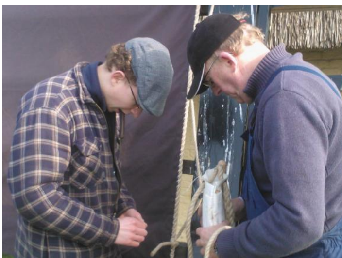
Leerling molenaars bij het vervangen van de zeilen