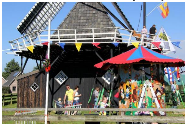
Friese Molendag bij de Vlijt in Koudum

Op de Friese Molendag organiseert de Actieve Vriendenclub Van de Koudumer molen diverse activiteiten rondom de molen. De Vlijt trok tijdens deze molendag meer dan 200 bezoekers.