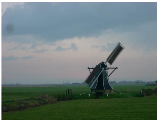
Molenmakers van Agricola Bouw '75 op Ybema's Mole. Rechts malend met één roede.